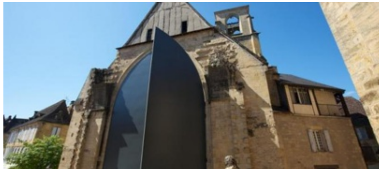
Marché couvert SARLAT (une des anciennes églises)

La présence de ce patrimoine est un vecteur identitaire (rappelons nous l'affiche de François Mitterrand avec dans le fond une église !) ; c'est un espace de cohésion sociale, un outil de rayonnement local et national, un atout touristique (qu'il soit isolé seul ou en groupe)