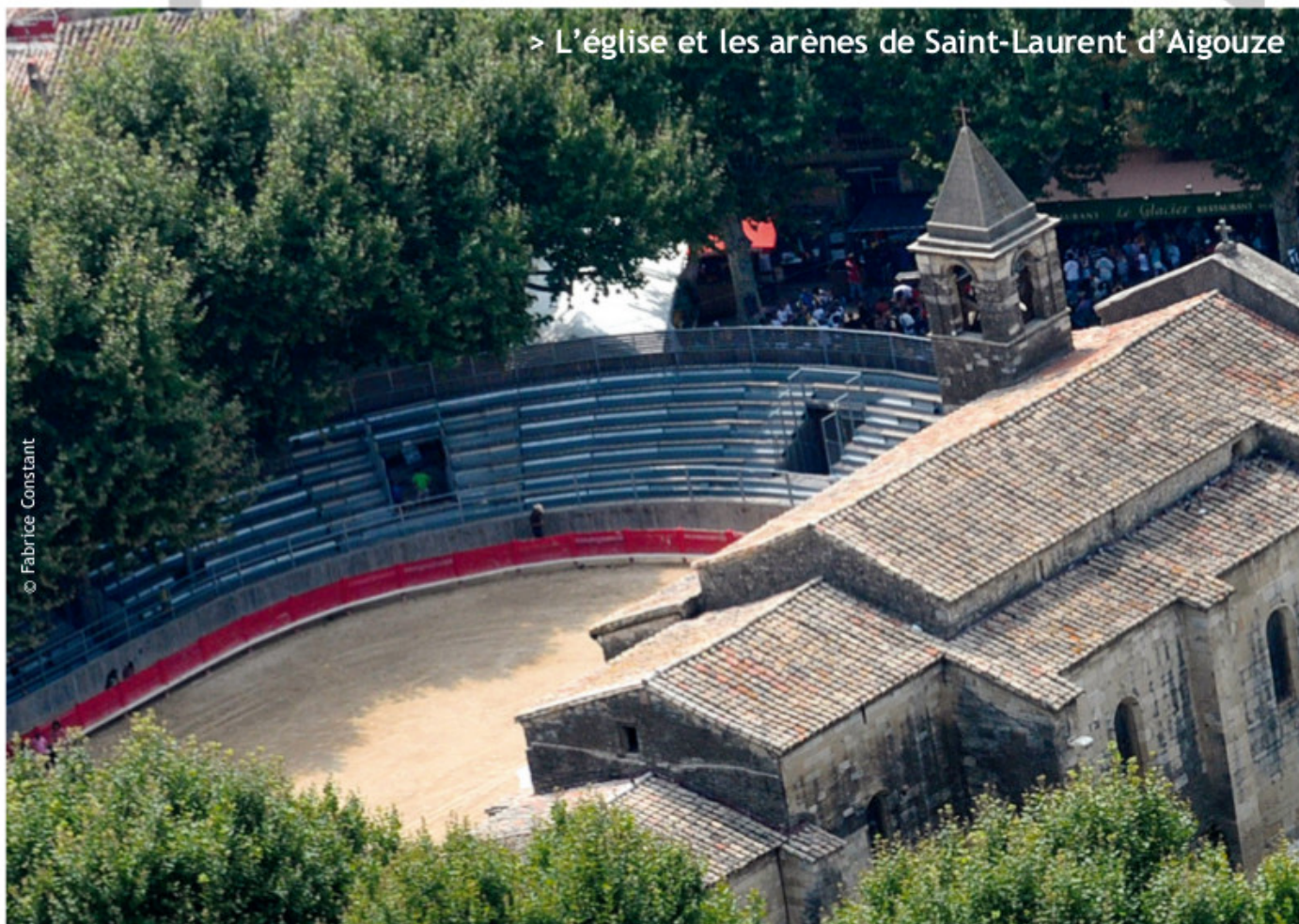
> L'église et les arènes de Saint-Laurent d'Aigouze

Réservation : Renvoyer les bulletins d'inscriptions avec le chèque d'acompte de 30 % à l'ordre de Li Coutet Negre 7 rue du Docteur Roux 30220 Saint Laurent d'Aigouze avant le 28 février et le solde avant le 31 mai 2013.