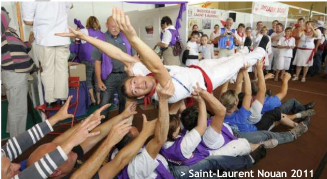
> Saint-Laurent Nouan 2011