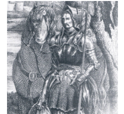
Seguin de Badefol